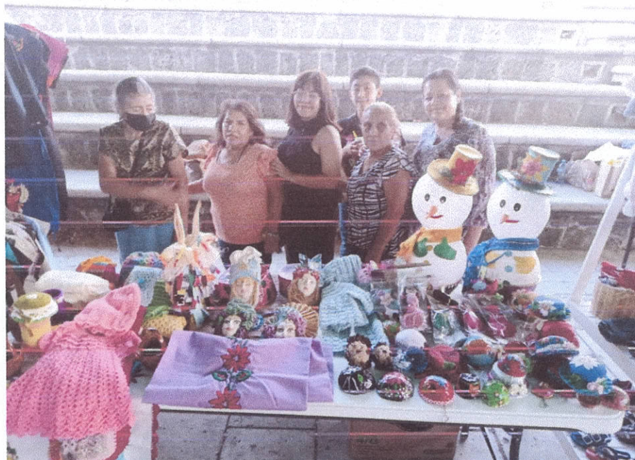
Reporte fotográfico Componente 2 Actividad 2.5