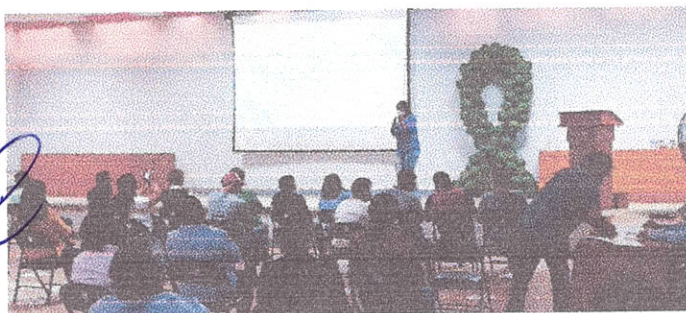
Imagen 1 de la actividad 2.2

Las actividades generales que se realizan pretenden hacer que las personas asuman los principios del modelo de Ciudad Educadora. El día 16 de febrero se realizó una plática sobre el modelo de Ciudad educadora y taller de residuos sólidos urbanos y elaboración de composta dirigido a los sindicalizados de la Sección 35 del sector salud. El 3 de marzo fue una charla sobre la historia de Oaxaca: conociendo al General Porfirio Díaz con alumnos y alumnas del quinto año del grupo B de la Escuela Primaria Presidente Alemán. Sumando una atención de 97 personas.