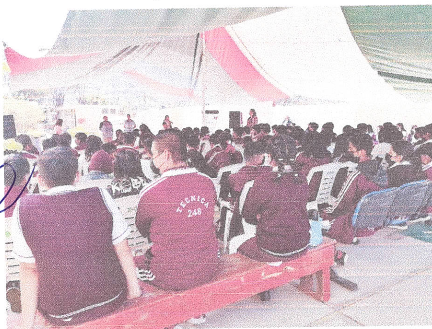
Imagen 1 de la actividad 2.1

Se ha impartido ésta plática a dos secundarias, la Est. Núm. 177 y la Est. Núm. 248, se imparte a toda la escuela, durante dos días en cada una, donde se distribuyen los alumnos de primer, segundo y tercer año. En total 1,226 alumnos y alumnas han recibido esta plática.