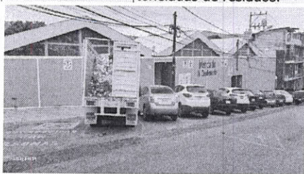
Acciones diarias de saneamiento mediante la recolección de residuos en el Mercado Cuarto Centenario del Municipio de Oaxaca de Juárez.

Se realizó la recolección diariamente del Mercado de Abastos del Municipio de Oaxaca de Juárez.