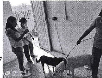
Esterilización de felinos y caninos en la colonia 7 Regiones del Municipio de Oaxaca de Juárez