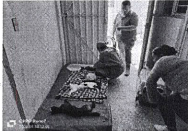
Esterilización de felinos en la Unidad Habitacional Benito Juárez, del Municipio de Oaxaca de Juárez.