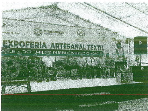
Foto: Expoferia Artesanal en Pueblo nuevo

Se realizaron 2 acciones entre los sectores empresariales para la promoción turística del municipio, la primera consiste en fomentar el desarrollo de los negocios, se generaron reuniones con agrupaciones de comerciantes y empresarios de la zona de Pueblo Nuevo y el Barrio de Xochimilco, por lo cual se determinó generar ferias artesanales en cada sector para impulsar el Turismo y la generación de nuevos espacios, en el cual participaron 50 microempresarios y emprendedores.