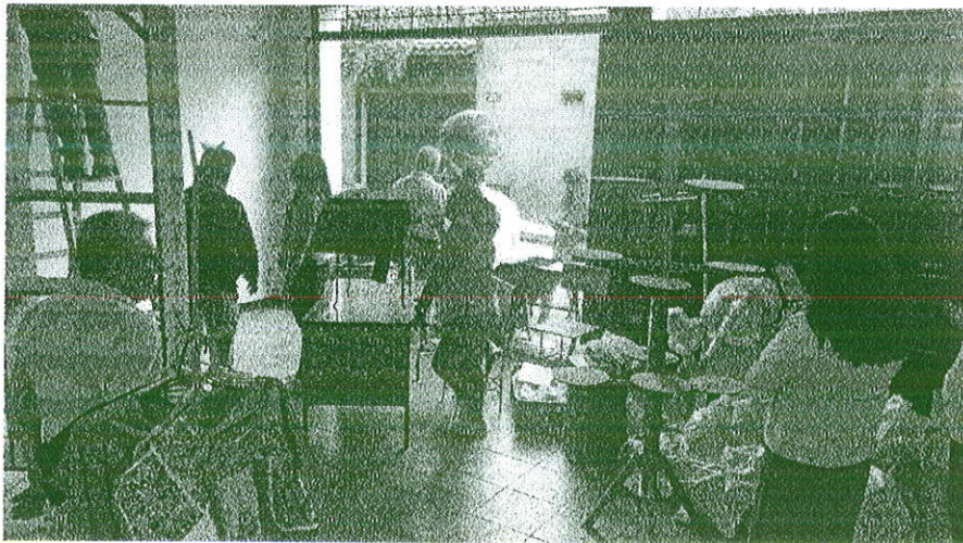
Foto: Tienda Municipal Artesanal, en Faustino G. Olivera 108.

Por eso se realizan juntas con la gran participación de los empresarios que ayudan a la construcción de una mejor ciudad, con empleo y derrama económica que beneficia a todas y todos. Por lo cual se ha trabajado en conjunto una nueva estrategia de atracción turística para que puedan observar en un solo espacio los grandes productos de los artesanos. Por lo tanto, esto representa el porcentaje alcanzado del 35%.