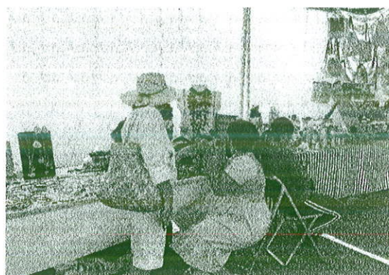
Expoferia Artesanal en Xochimilco.

Y la segunda es desarrollar reuniones con micro empresarios de la Ciudad de Oaxaca, en donde se compartió el proyecto de crear una Tienda Municipal de Artesanías como una alternativa para el turismo que busca en la capital productos artesanales originales de calidad. En el cual participan 11 microempresarios que cumplieron con todos los requisitos de la convocatoria. Por lo tanto, esto representa el porcentaje alcanzado del 35%.