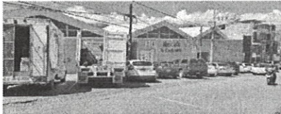
Acciones diarias de saneamiento mediante la recolección de residuos en el Mercado Cuarto Centenario del Municipio de Oaxaca de Juárez.