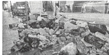
Se realizó la recolección diariamente del Mercado Benito Juárez, del Municipio de Oaxaca de Juárez.