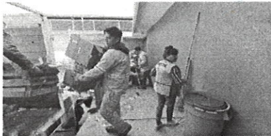
Acciones de saneamiento del Mercado de la Merced, del Municipio de Oaxaca de Juárez.