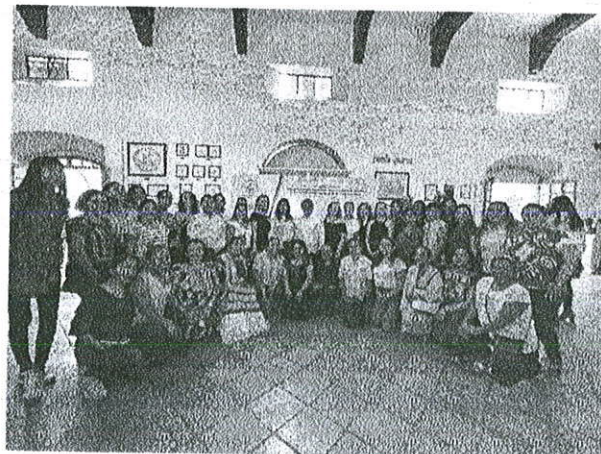
Foto: Firma de convenio con CCEM Capítulo Puebla en el Salón Expresidentes

Además se trabajó en conjunto una nueva estrategia de atracción turística para las y los ciudadanos del municipio de Puebla y así visiten Oaxaca de Juárez. Por lo tanto, esto representa el porcentaje alcanzado del 35%.