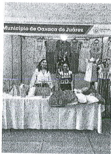
Foto: Artesanas en el Congreso Nacional de Mujeres Empresarias en Puebla.

Por lo tanto, esto representa el porcentaje alcanzado del 35%.