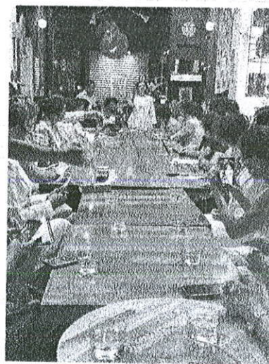
Foto: Reunión con CCEM para promoción del actividades para el municipio de Oaxaca de Juárez