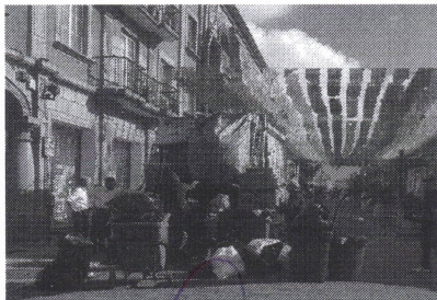
Recoleccion de residuos solidos inorganicos en diferentes restaurantes del centro de la ciudad