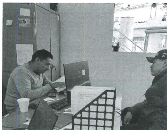
Personal administrativo de la unidad de panteones llevando a cabo trámite de inhumacion de restos.