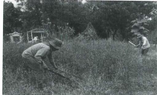
Acciones de limpieza en áreas comunes en el Panteón San Miguel