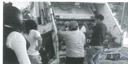
Recoleccion de Residuos solidos organicos