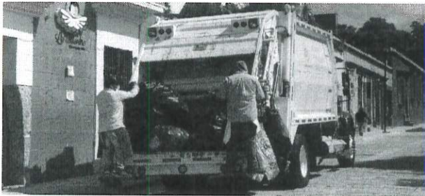
recoleccion de residuos inorganicos en el Municipio de Oaxaca de Juarez.

Se realizaron la recolección de residuos solidos en rutas establecidas, se atiende a las 13 Agencias Municipales y de Policía, así mismo se atendieron los panteones municipales en la temporada de muertos, incrementando la recoleccion de organico por las festividades de los fieles difuntos.