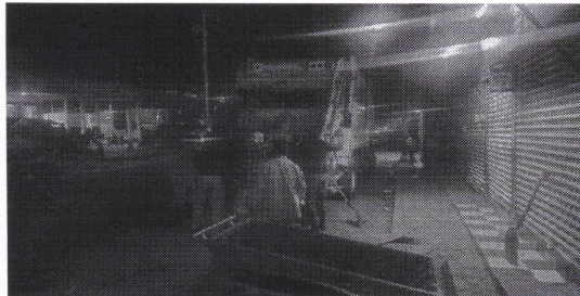
Recoleccion de residuos en las oficinas de traslado de valores, COMETRA