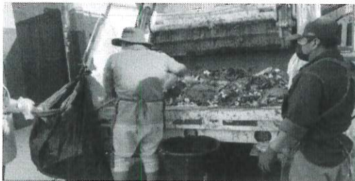
Se realizó la recoleccion de residuos solidos urbanos