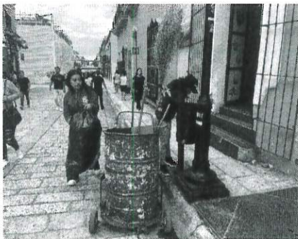
Se recoleccion de RSU de las papeleras instaladas en el centro histórico.