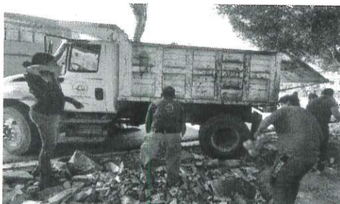
Acciones de levantamiento de escombros y tierra excedente producto de los servicios de inhumación