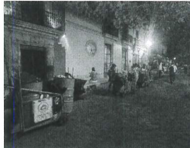
Con las cuadrillas por necesidades de área se atendió los 3 turnos el centro histórico durante las festividades de los fieles difuntos para mantener limpios los espacios públicos