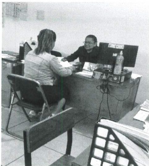
Personal administrativo de la unidad de panteones llevando a cabo un trámite de inhumación.

Durante el cuarto trimestre del presente año la unidad de panteones realiza diferentes trámites administrativos, tales como cambios de titular y/o cesiones de derecho, expediciones de certificación de póliza, permisos de construcción, Re inhumaciones o depósitos de cenizas y adquisiciones a nuevos contribuyentes que no contaban con espacios en alguno de los panteones administrados por el municipio de Oaxaca de Juárez.