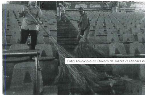
Se atendieron eventos de la unidad de tramites empresariales que solicitaron el barrido y limpieza antes y después