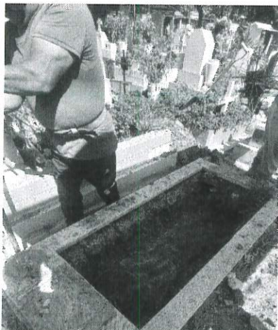
Personal operativo del panteón Xochimilco llevando a cabo los trabajos de inhumación.

Durante el cuarto trimestre del año 2024, se realizaron un total de 122 inhumaciones en los cinco panteones administrados por el municipio de Oaxaca de Juárez, siendo estos el panteón san miguel, panteón general, panteón marquesado, panteón Xochimilco y panteón Jardín.