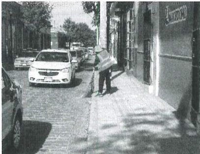
Barrido manual de las calles del Municipio de Oaxaca de Juárez.

Se realiza el barrido diario de 2200 calles que comprenden el centro histórico, y municipio de Oaxaca de Juárez. Se apoyo en las diferentes festividades conmemorativas a las fiestas de los fieles difuntos tales como Mega comparsas, comparsas, conciertos masivos en alameda, plaza de la danza y calendas organizadas por las agencias municipales y dependencias tanto de gobierno del estado como municipio de Oaxaca de Juárez. se realizo la limpieza de las calles que comprenden el desfile del 114 aniversario de la revolución mexicana. Se realizo la atención a todos los eventos reportados a la UNIDAD DE TRAMITES EMPRESARIALES que corresponde al departamento de barrido y aseo publico. se realizo la limpieza en plaza de la danza con motivo del sorteo del servicio militar. se atendieron las festividades de diciembre en el centro histórico, entre ellas la noche de rábanos antes durante y después de su realización. se capacito en NORMAS OFICIALES MEXICANAS - STPS a la cuadrilla de compactación para un mejor manejo de espacios de trabajo.