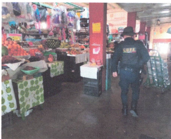
Mercado Sánchez Pascuas