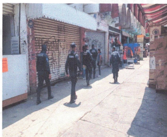
Central de abasto