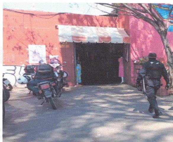
Mercado de la Merced