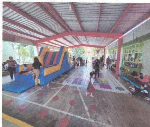
Ferias de la prevención