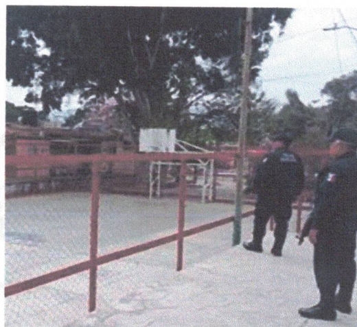
Presencia y disuasión