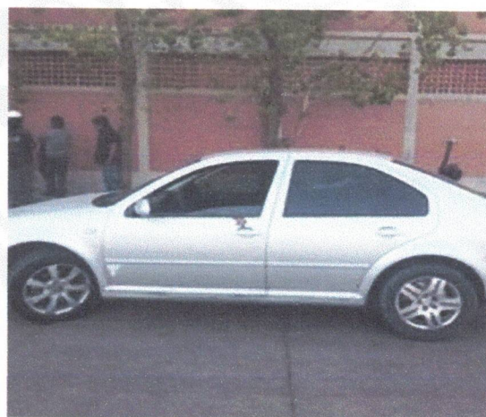
Controles provisionales preventivos