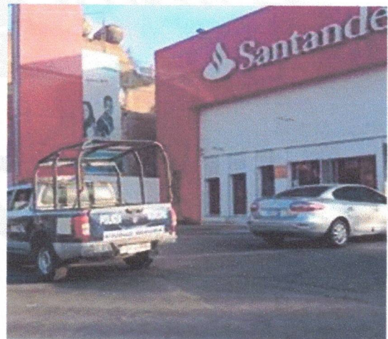
Bancos y cajeros ATM