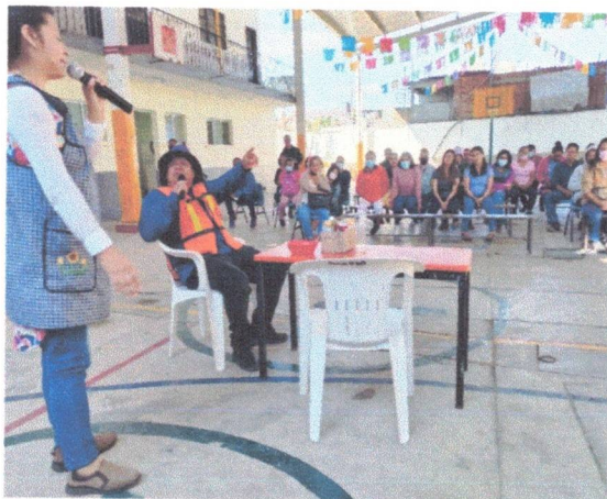
Sociodramas en temas de prevención de la violencia