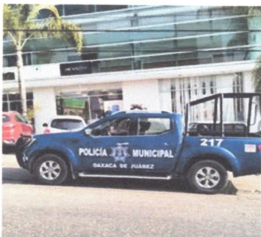
Operativo Reforma segura