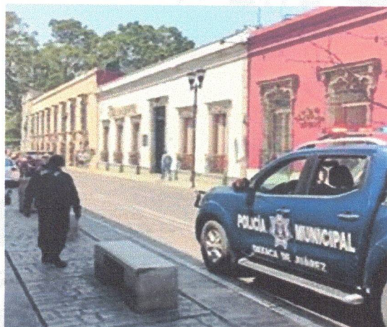
Presencia y disuasión