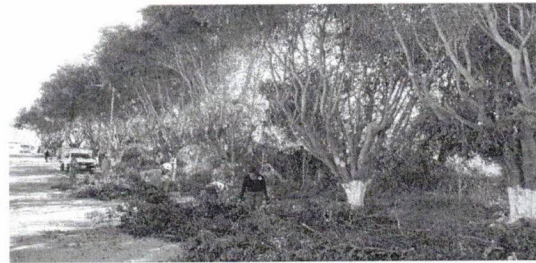
Poda de arbolado urbano ubicado en áreas públicas.