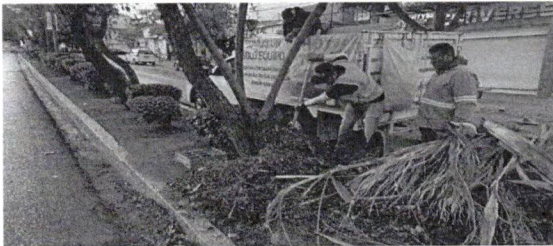
Poda de arbolado urbano ubicado en áreas públicas.

El personal de Atención a Parques Jardines y Fuentes cuenta con 9 unidades de las cuales 6 son de recolección diaria de producto de limpia de jardines y camellones, 2 unidades tipo grúa para actividades de poda y derribo de arbolado urbano, una unidad para supervisión, transporte de personal y diversas actividades según las necesidades del área. Actualmente se cuenta con 180 trabajadores distribuidos en diversas áreas de trabajo, se atiende 25 jardines, 2 parques, 19 camellones y 6 glorietas con personal permanente. Se cuenta con dos brigadas de atención a dictamen emitidos por la secretaria de Medio Ambiente y Cambio Climático para la poda y derribo de arbolado urbano.