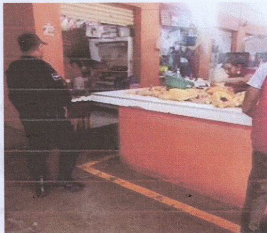
Mercado la Noria