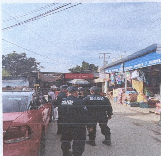
Central de abasto