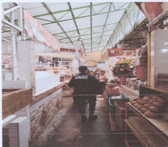
Mercado 20 de Noviembre