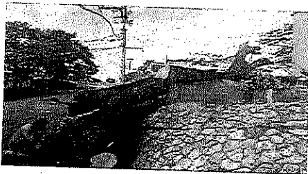
Atencion a queja sobre arbolado caido por lluvias