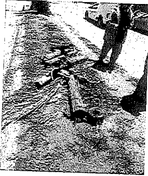
Se inicia con el derribo de palmeras en estado deficiente sobre Av universidad

El departamento de Atención a Parques Jardines y Fuentes durante el periodo de 01 de abril al 30 de junio del 2024 ha realizado la cantidad de 281 podas y 83 derribos con sustitución. derivado a esto las unidades del departamento realizaron el levantamiento de 1692 toneladas de residuos orgánicos con las camionetas de recolección en los jardines, parques, camellones y glorietas. Se cuenta con 2 unidades tipo grúa para actividades de poda y derribo de arbolado urbano, una unidad para supervisión, transporte de personal y diversas actividades según las necesidades del área. Actualmente se cuenta con 180 trabajadores distribuidos en diversas áreas de trabajo.