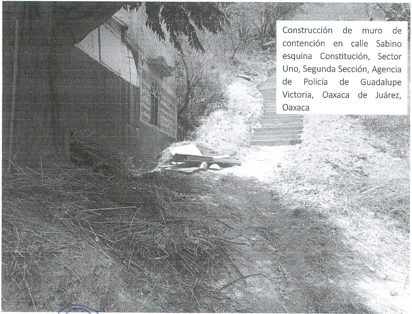
Construcción de muro de contención en calle Sabino esquina Constitución, Sector Uno, Segunda Sección, Agencia de Policía de Guadalupe Victoria, Oaxaca de Juárez, Oaxaca