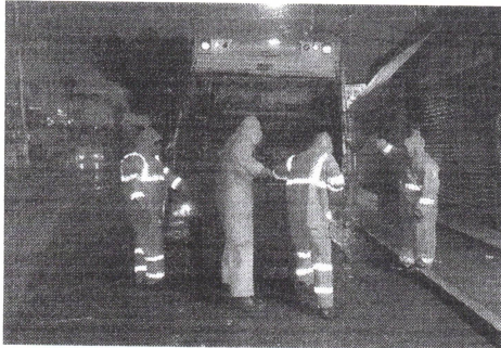
Operativo nocturno exterior de la central de Abasto.