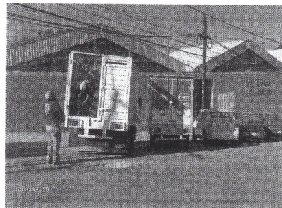
Recolección de residuos organicos en el mercado IV Centenario.