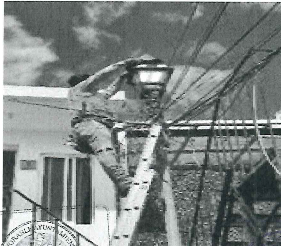
Rehabilitación de luminarias en Infonavit Primero de Mayo