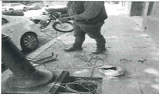
Reposición de cableado eléctrico en el circuito de Carr. Internacional 190, Pueblo Nuevo

Además de las acciones realizadas para la rehabilitación y mantenimiento del sistema de alumbrado público en el Centro Histórico, cabecera municipal y colonias de las agencias municipales y de policía, se instalaron 3,131 metros lineales de cable eléctrico por reposición de cable por robo o por que se encontraba dañado por causas normales.