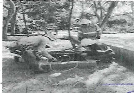
Reposición de cableado en registro en el Paseo Juárez el Llano