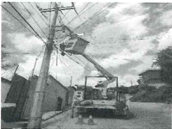
Rehabilitación de luminaria col. Volcanes

Resumen: Se atendieron 1225 reportes de la ciudadanía recibidos a través de diferentes canales, como solicitudes por oficio, reportes telefónicos, solicitudes realizadas en dialogos vecinales y de manera personal en las oficinas de la Secretaría de Servicios Vecinales. se rehabilitación de luminarias, de circuitos, sustitución de luminarias en mal estado en Centro Histórico colonias de la cabecera Municipal y en las colonias de las agencias municipales y de policía del Municipio de Oaxaca de Juárez