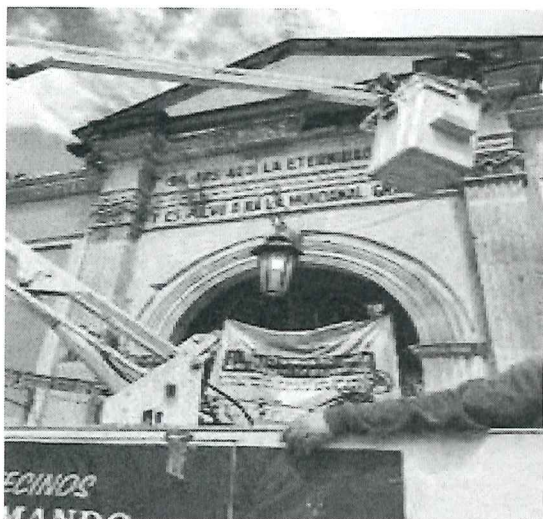
Rehabilitación de Luminarias en el panteón General

Resumen: Con las cuadrillas del Departamento de Mantenimiento de Luminarias, se proporcionó mantenimiento al sistema de alumbrado público, se realizó sustitución de luminarias, se remplazaron materiales de las mismas para su rehabilitación, se intervinieron circuitos y se instaló cableado para energizarlas.