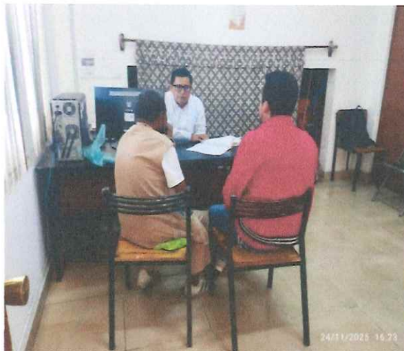
Juzgado Cívico Municipal Especializado Tránsito Terrestre