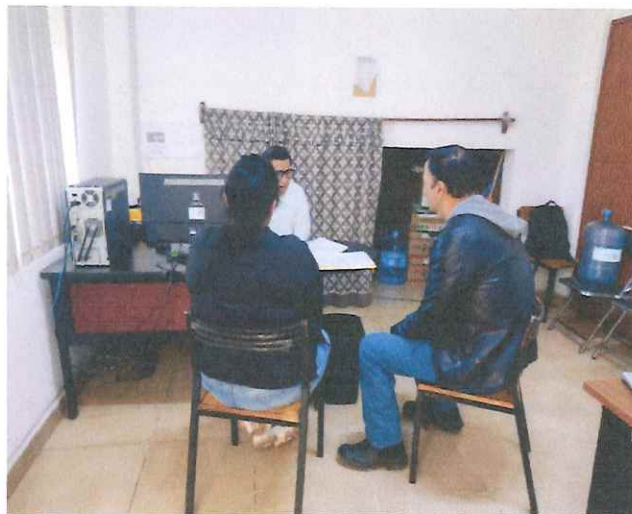
Juzgado Cívico Municipal Especializado en Faltas Administrativas para la Buena Convivencia Comunitaria.

Nombre del indicador: Porcentaje de acciones de supervisión al desempeño de los jueces cívicos realizadas.