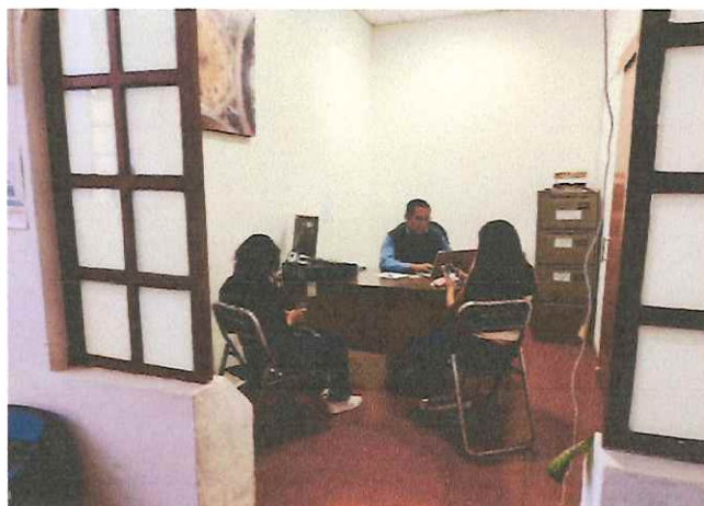
Juzgado Cívico Municipal Especializado en Conciliación y Mediación