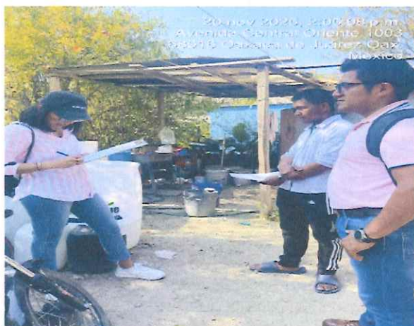
Juzgado Cívico Municipal Especializado en Maltrato Animal